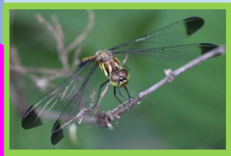
トンボの名前はウラを見てね！