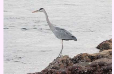
【アオサギ】(留鳥) 島のクスノキに巣(す)がある