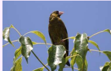
【カワラヒワ】(留鳥) クスノキなどの実を食べるよ