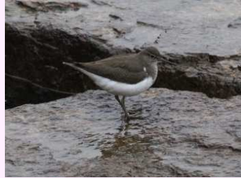
【イソシギ】(留鳥) 海辺やしばふを歩いているよ