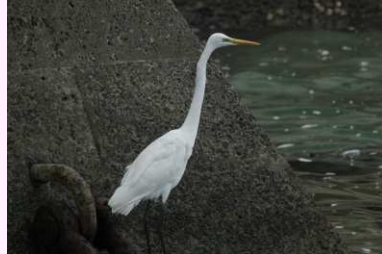
【ダイサギ】(留鳥) 海辺にいる大きな白いサギだよ