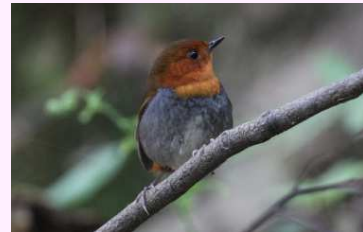
【コマドリ】(旅鳥) 「ヒン、カラララ」と鳴くよ