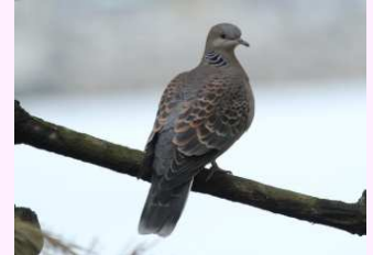
【キジバト】(留鳥) 「デデポッポー」と鳴くよ