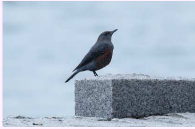
【イソヒヨドリ】(留鳥) いい声でさえずるよ